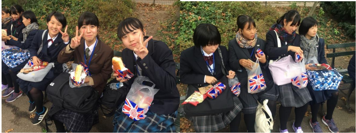
セントラルパークでの昼食