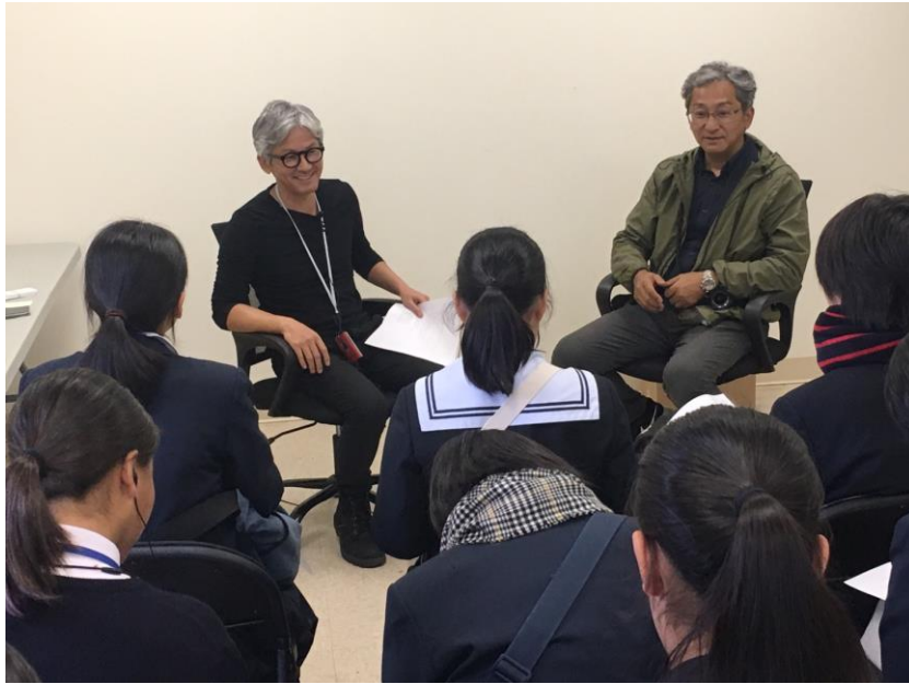
左：台信商店マンハッタン支店総責任者（社長の弟様） 右：台信商店社長