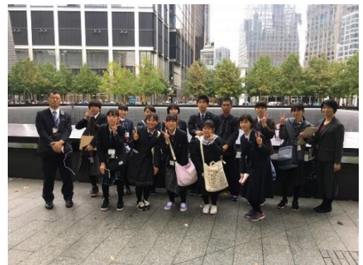
世界貿易センター跡地