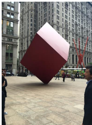
モニュメント「不安定な金融世界」