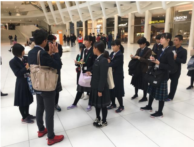
ウェストフィールドのショッピングセンター