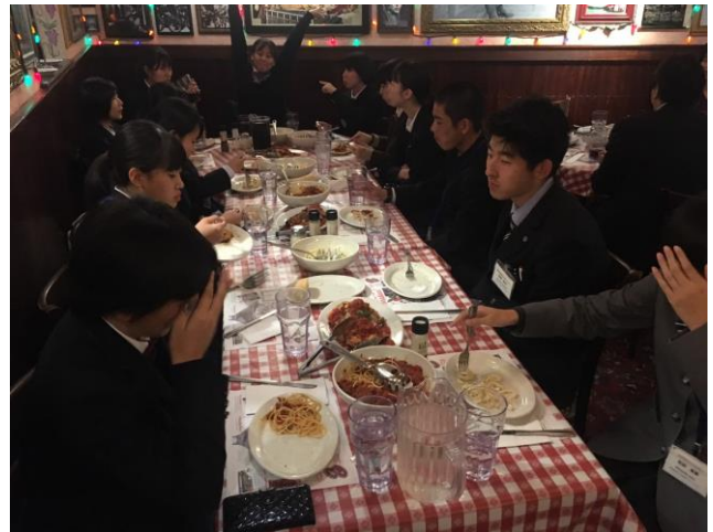
夕食の様子（パスタ）