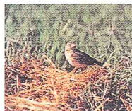
県の鳥：ヒバリ Prefectural Bird Lark