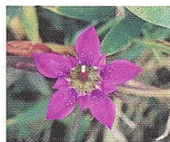
県の花：リンドウ Prefectural Flower Gentian