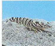
県の魚：クルマエビ Prefectural Fish Prawn

統計は、私たちが暮らしの現状を知り将来を予測するうえで重要な役割を果たしています。