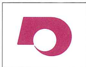
県章(昭和41年3月制定) Prefectural Mark (adopted in March 1966)

県章は「クマモト」の「ク」を図案化するとともに、九州の地形をデフォルメしたもので、中央の円は九州の中心に位置する本県を象徴し、伸びゆく県勢を力強くたくましく表現している。