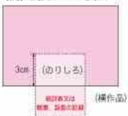
(例) 統計グラフ表面

グラフ部分をパソコンで作成したもの（下書きしたものを含む）は、パソコン統計グラフの部の作品として応募してください。