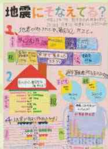
地震にそなえてる？