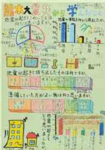
熊本大震災から学んだこと