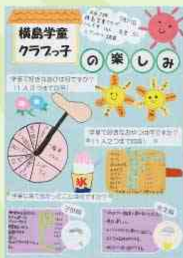
横島学童クラブっ子の楽しみ