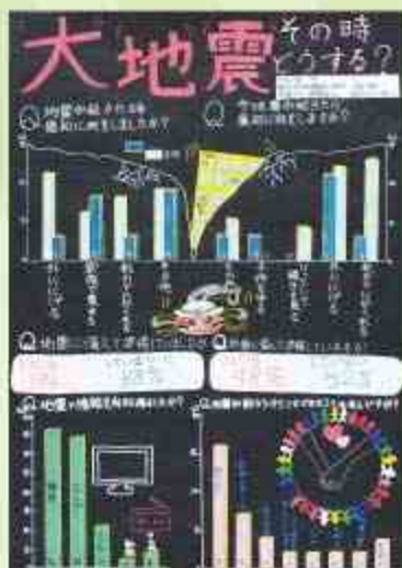
大地震 その時どうする？