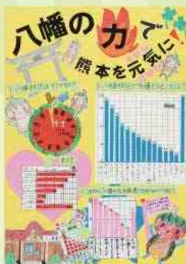
八幡の力で熊本を元気に!