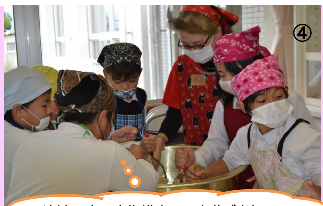
④ 地域の方々を指導者に、味噌づくりに挑戦中です。