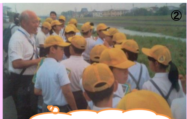
② 町内を流れる氷川を観察しています。