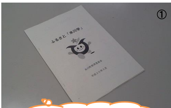
① このような冊子にまとめて紹介しています。