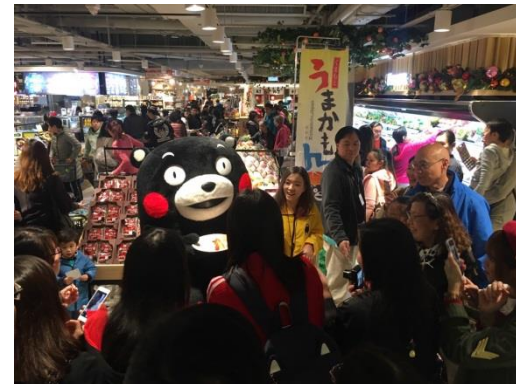
香港でのプロモーション