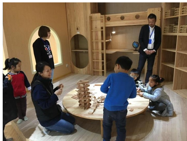
中国山東省済南市の商業施設内における子供部屋モデルルーム(県内事業者が受注)

○韓国・台湾では、日本産のヒノキが人気であり、家具用、内装用として丸太の輸出が増加。