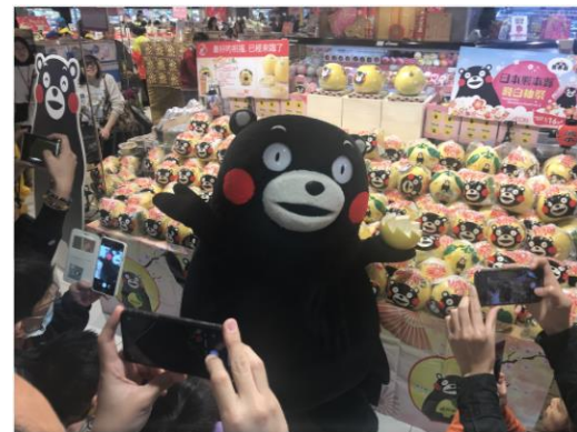
香港でのプロモーション

○既存国・地域へのさらなる輸出拡大と、新規国・地域の市場開拓を図るため、バイヤー招へいや現地での販売プロモーションなど、商談機会の創出に取り組んだ。