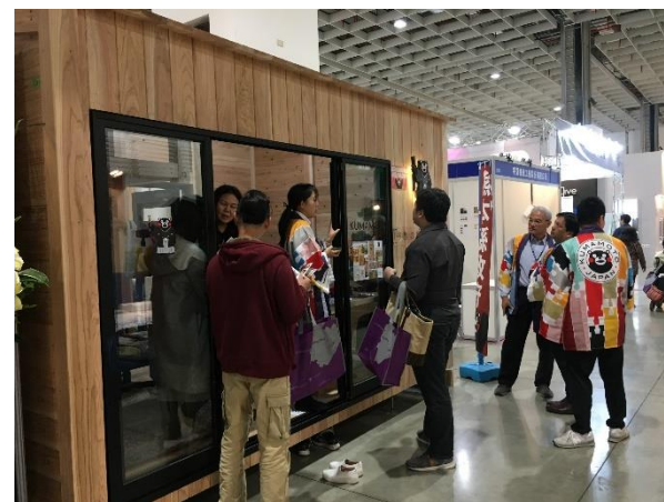
台湾台北市で開催された台北ビルディングショーにおけるモデルルーム

○製材品は、数量、金額ともに減少したが、アメリカ(戸建て住宅フェンス用)において、輸出拡大に向けての取組が定着し、今後、伸びが期待できる。