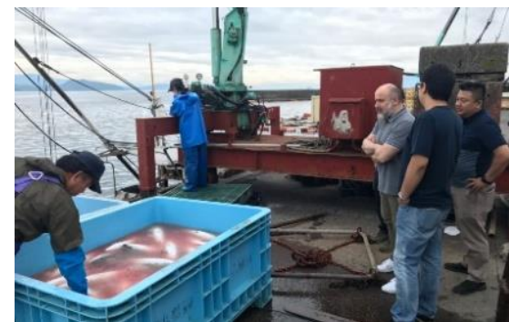
イタリアからのバイヤーを招いた視察状況