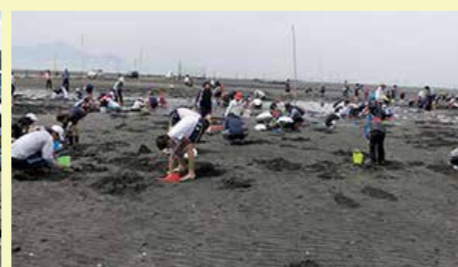
潮干狩り風景(宇土市)