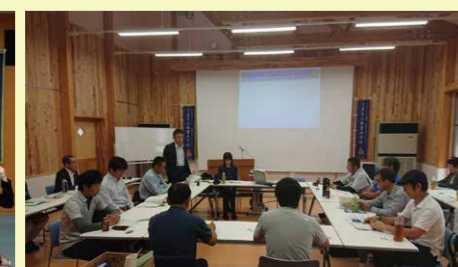
森創館での研修風景