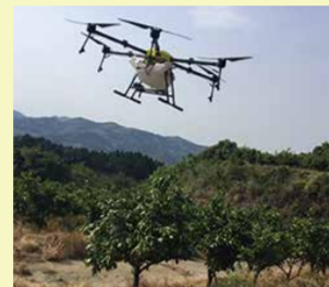
ドローンによる病害虫防除

農業者の誰もが安心してスマート農業に取り組めるよう、機器などの導入判断の目安となる経営指標作成や、フォーラム開催、農業情報サイト開設(12月末公開予定)などに取り組んでいます。