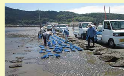
漁業者によるアサリ母貝保護