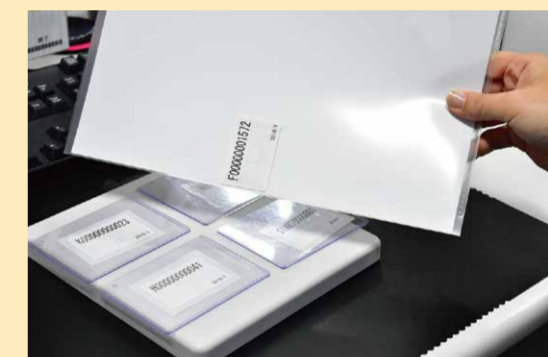
ICTagsの導入で業務の効率化を図っている

県内企業の生産性向上を後押しするため、IoTの普及啓発、人材育成、モデル形成、投資支援などを行い、IoTの導入を進めています。