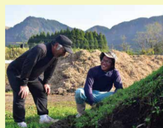
研修受け入れ農家で修行中(阿蘇市)

多様な就農希望者(新規参入、新規学卒、Uターンなど)が、安心して就農できるよう、相談会や農家などでの研修、経営開始時のハウス導入に対する助成など、きめ細かなサポートを切れ目なく行っています。