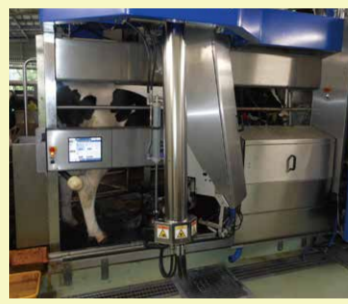
搾乳ロボットによる全自動での搾乳

私たちがレポートします！ 熊本県内の大学生で構成される「たより隊」が熊本県のお知らせを、分かりやすくレポートします。