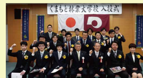
くまもと林業大学校入学式