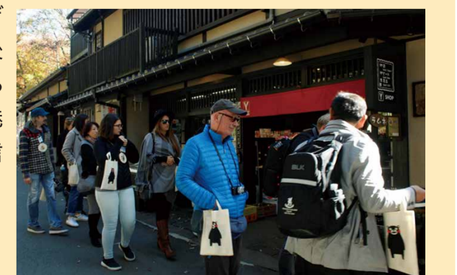
ラグビーワールドカップ2019™期間中の黒川温泉(南小国町)

国際スポーツ大会の開催に合わせて、欧米などへの情報発信や受け入れ環境の整備を行い、海外からの観光客で熊本城や黒川温泉など、大変にぎわいました。今後さらに、誘客できるよう、さまざまな魅力を効果的に発信していきます。