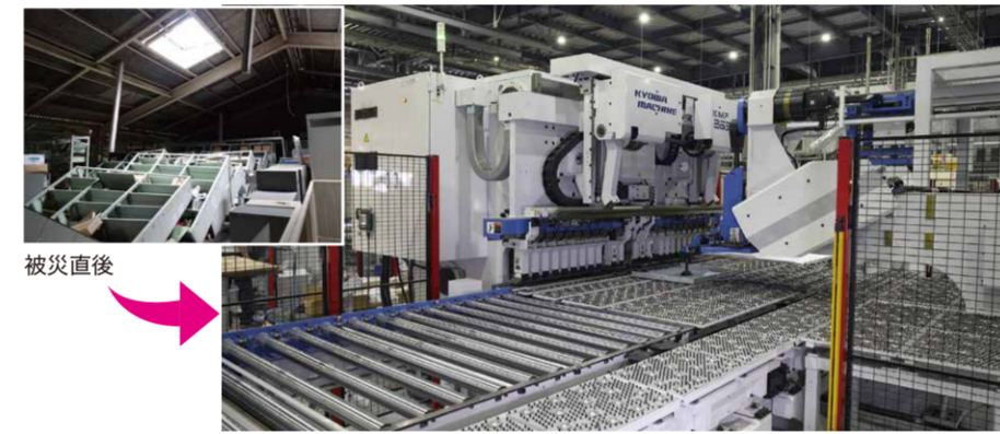
被災直後 復旧した設備(金剛(株))

被災企業の事業再建に向け、グループ補助金による支援を行い、11月末の復旧完了率は96.9%となりました。引き続き、売上回復などに向けて、専任スタッフによる経営支援など、被災企業に寄り添った支援を行っていきます。