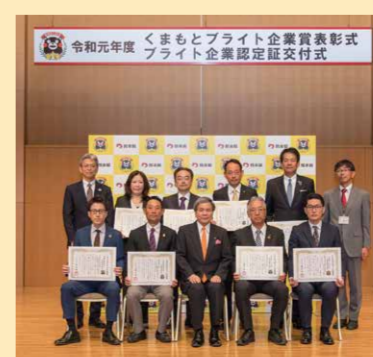
くまもとブライ企業賞表彰式