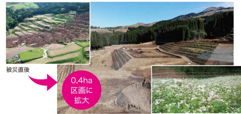
被災直後 0.4ha 区画に拡大 復旧農地でのそば生産

農地及び営農施設の復旧による営農再開や被災農地の大区画化などによる創造的復興を支援しています。11月末現在の営農再開率は99.8%となりました。