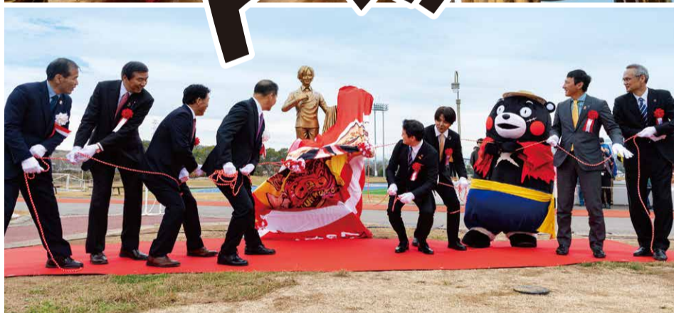
12月7日 サンジ像除幕式(益城町交流情報センター・ミナテラス)