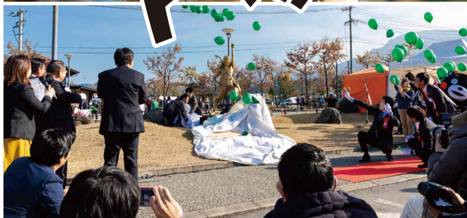
12月8日 ウソップ像除幕式(JR阿蘇駅前)