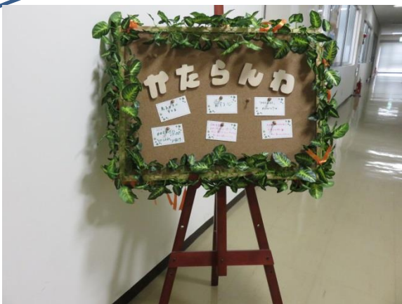
♡♥入口に“かたらんね”メッセージボード♡♥