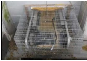
開口部の隙間対策