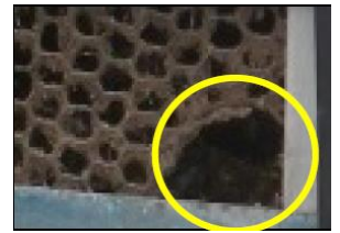
金網等の破損箇所修繕