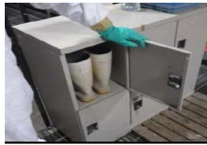
家さん舎専用の靴の使用