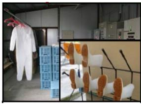
専用衣服や靴の使用

各農場におかれましては、これまで以上に、飼養衛生管理基準の遵守の徹底や野生動物の侵入防止対策により、鳥インフルエンザウイルスの侵入防止を図るとともに、異常時の早期発見・通報について、よろしくお願ひします。