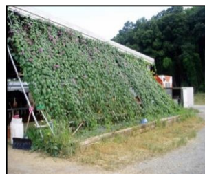
グリーンカーテン（ネット+植物）