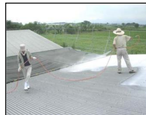
屋根への石灰吹き付け