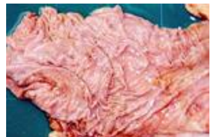
粘膜病発症牛第四胃潰瘍