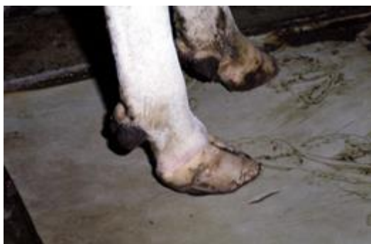
削蹄前の蹄。 重心が繋（つなぎ）の部分にかかって繋が低くなっています。