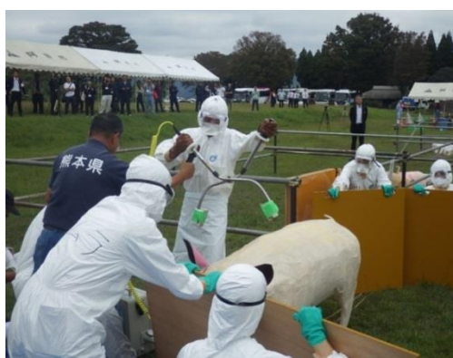
模型を用いた殺処分の演習

実地演習では、日齢の異なる豚の模型を用いて、 日齢や豚舎構造の違いに応じた殺処分方法 について演習を行いました。また、 カゴ台車を用いた資材の搬入方法 や 消毒ゲートによる消毒 等、過去の防疫対応から得られた、防疫作業の改善策についても実演を行いました。