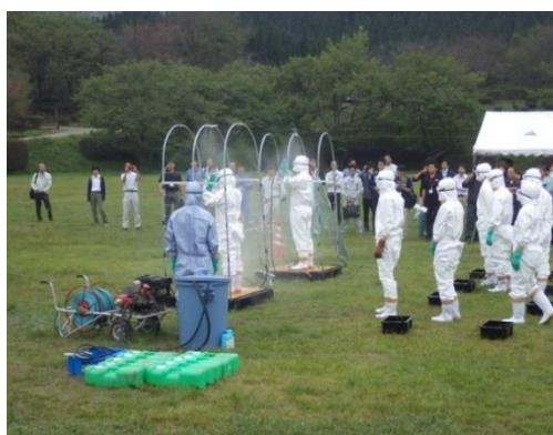
消毒ゲートによる消毒方法の実演