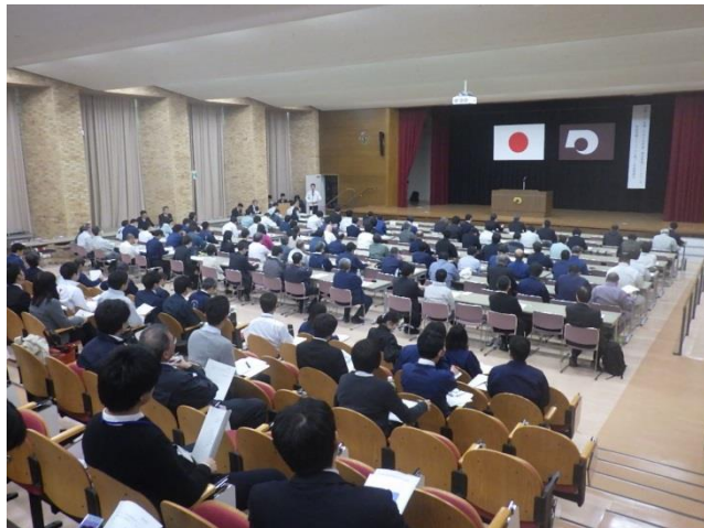
熊本県防疫研修会の様子

について説明し、多くの農林水産部職員が出席しました。平成26年度のように定期人事異動直後の発生でも迅速な対応ができるように、防疫作業について再確認しました。