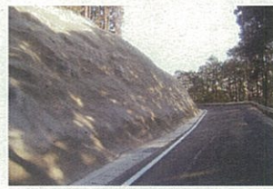
工事名:玉名立花線岩風災害防除(自然償)工事 企業名:株式会社吉田工業 現場代理人主任技術者:村上哲雄 優れた点:砕石場が付近にありダンプ往來が激しい路線でしたが、地元や関係機関との調整及び工事工程的確なフォローアップにより、交通の円滑化に努めて施工を行った。