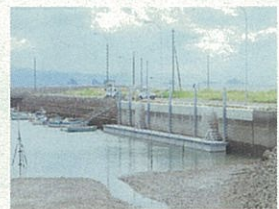
工事名:那珂津港地域水産物供給施設整備工事 企業名:三洲建設株式会社 現場代理人主任技術者:村田達也 優れた点:フロート留付時に職自に製作した吊金具使用による安全性と作業効率の向上が図られ、施工中の海水濁度測定により周辺環境への配慮がなされた。