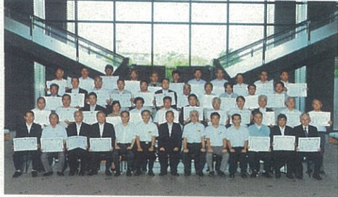
平成23年度熊本県優良工事等表彰式 平成23年7月29日 熊本県庁新館1階ロビー