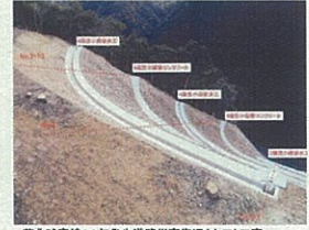
工事名:芦北線南線22年発生道路災害復旧(土工)工事 企業名:株式会社木崎建設 現場代理人主任技術者:藤林 謙 優れた点:安全面・施工能力面で優位な無人機械による切土施工の提案により、夜間作業が可能となり、約1ヶ月間の全開通進行止めが回避された。