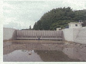
工事名:河原川広域河川(堰上部)工事 企業名:開成工業株式会社 現場代理人主任技術者:杉野成也 優れた点:住宅密集地で作業スペースも狭く、他工事と競合する等悪条件下での施工でしたが、積極的に周辺住民へ工事情報を提供し、トラブルも無く完成させた。