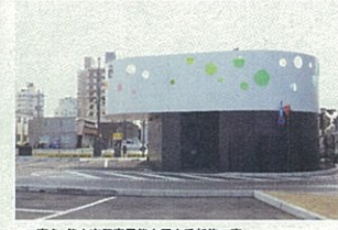
工事名:熊本県警察署熊本駅交番新築工事 企業名:株式会社小田建設 現場代理人主任技術者:岩永和夫 優れた点:アトリー事業による特殊な施工であったが、2階鉄板フェンスの施工精度向上のため、取付、清掃、閉止め、雨漏り防止等様々な施工方法の提案を行った。