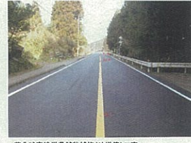
工事名:芦北線南線車庫改修(地産償)工事 企業名:株式会社松下組 現場代理人主任技術者:池崎文和 優れた点:既設舗装材を100%再利用した際の自主的なアスファルト添加物の設計や品質試験を行った。また、NETISの活用が図られました。