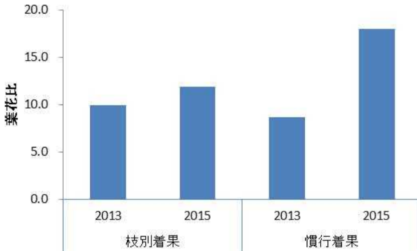
図1 着果方法の違いによる「熊本 EC11」の翌年の着花 注) 葉花比：総花数/旧葉数