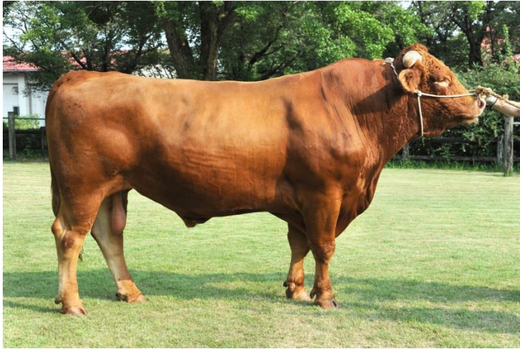
春五月 (はるさつき)