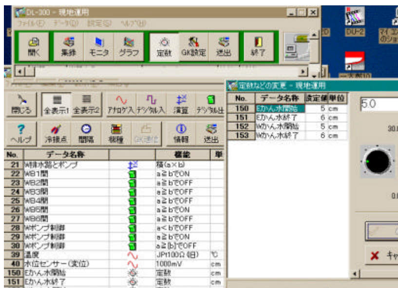
図2 操作画面（左下：水管理プログラム、右下：水位設定）