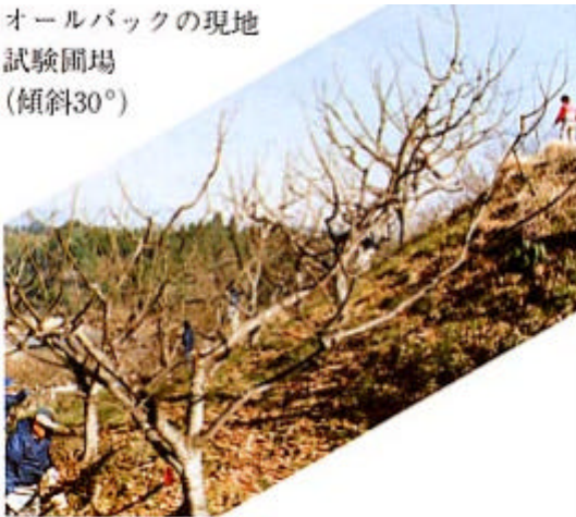
写真1 オールバックの現地試験ほ場