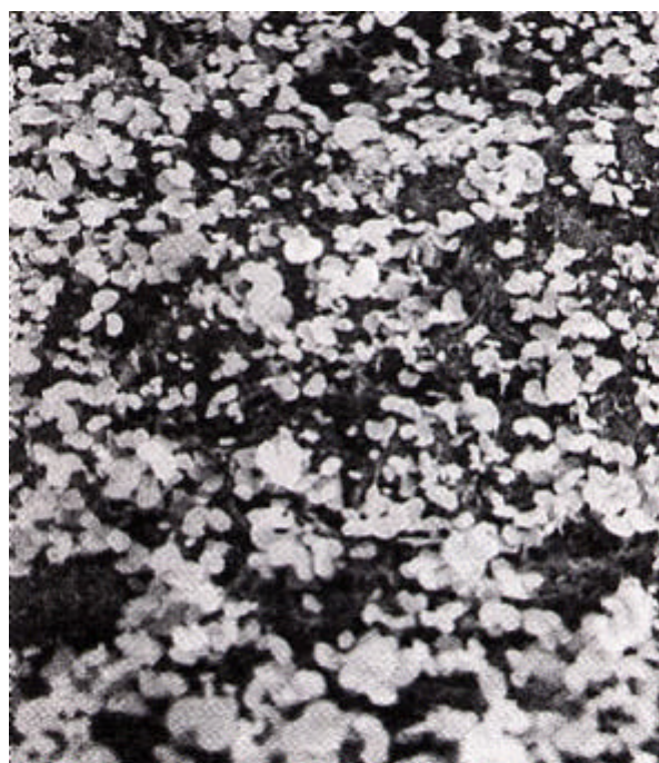
図4 水培地での生育