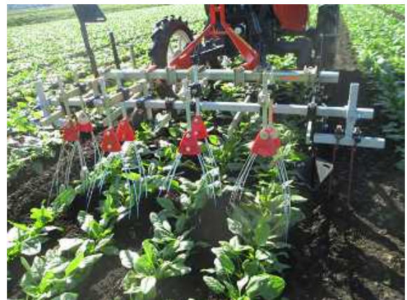
図 2 機械除草の様子