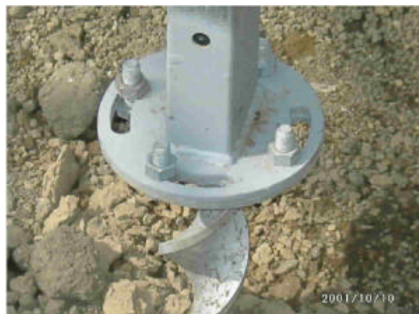
写真2 スパイラル杭 (設置途中の状況)