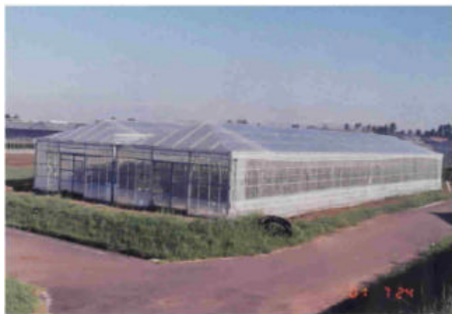
写真1 熊本型新園芸ハウス