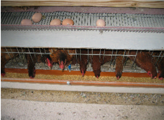
図 1 . 雌の給餌器設置状況