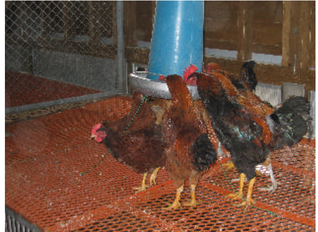
図 2 . 雄の給餌器設置状況