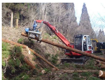
高性能林業機械操作研修