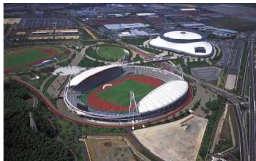
熊本県民総合運動公園陸上競技場