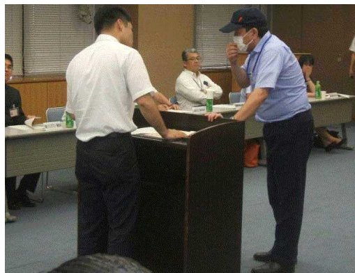
〈ロールプレイング訓練〉