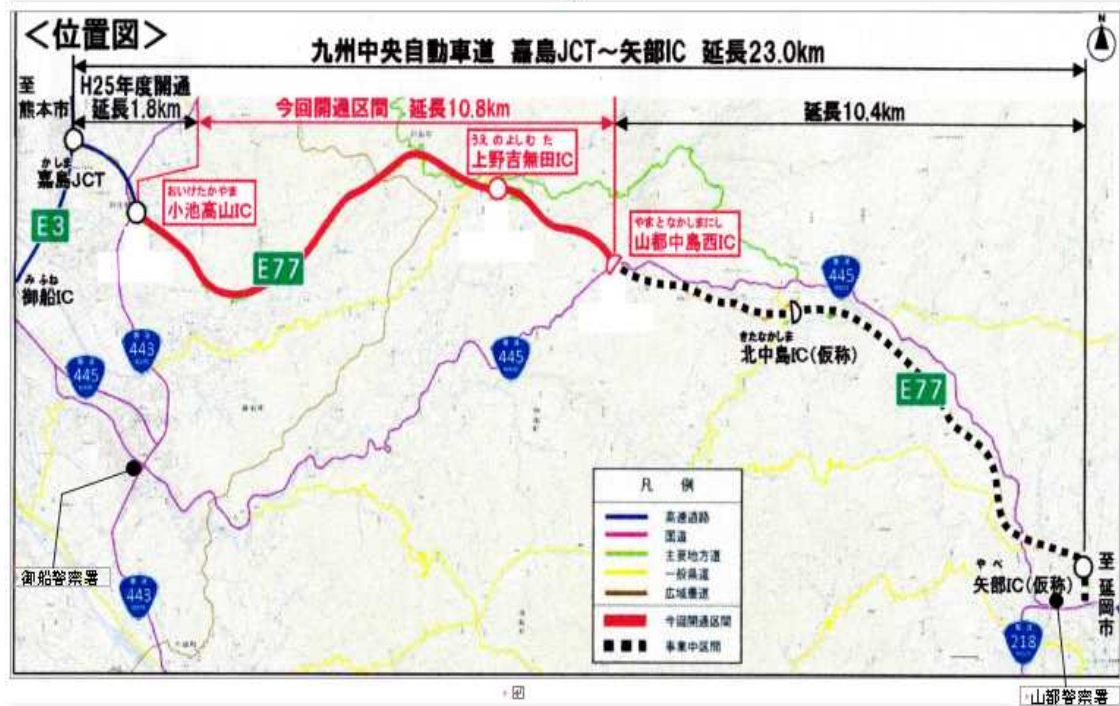
九州横断自動車道延岡線「小池高山IC～山都中島西IC」位置図