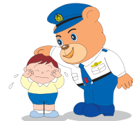
熊本県警シンボルマスコット ゆっぴー