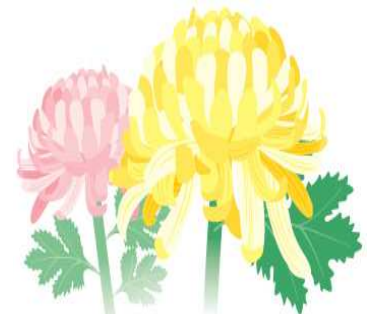
熊本県園芸課：「平成22年産熊本県花き生産実績」