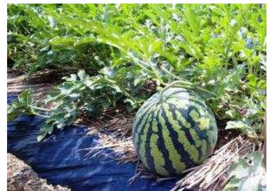
天草市上津深江地区の盆すいか(7月上旬~8月中旬)-

熊本の真鯛。「くまもとの赤」である「真鯛」の漁獲(収穫)量と消費量の関係 を調べてみました。熊本県の真鯛の漁獲量は846トンに対し、養殖による収穫量は8,789トン。全国第2位の漁獲・収穫量です。熊本市における「真鯛」の購入量は1年間で2,253gで、なんと全国平均(715g)の約3倍。「くまもとの赤」である真鯛をよく食べているというみかたができます。熊本県民は 真鯛 が好きなんです！！そういえば、先日は鯛の刺身を食べたことを思い出したのであります(筆者)。