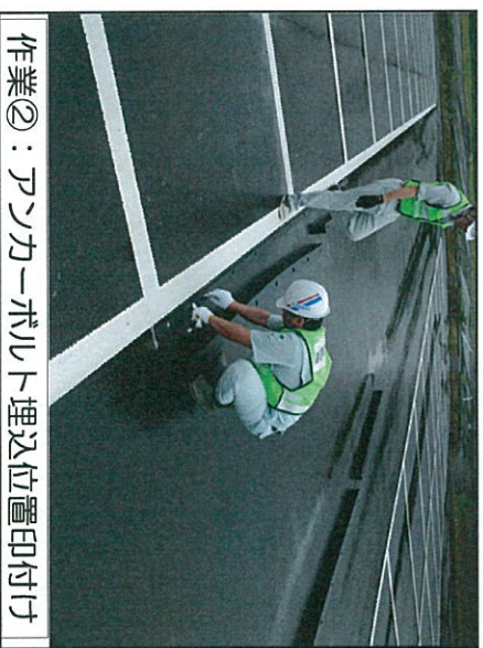
作業②：アンカーボルト埋込位置印付け