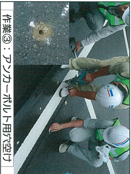
作業③：アンカーボルト用穴空け