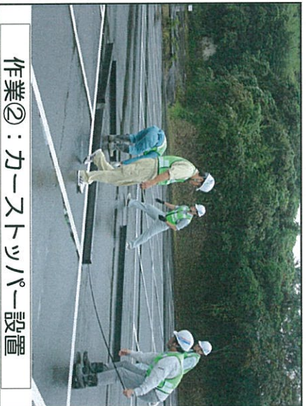
作業②：カーヌトツパー設置