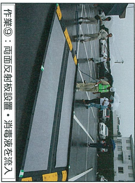
作業⑨：両面反射板設置・消毒液を流入