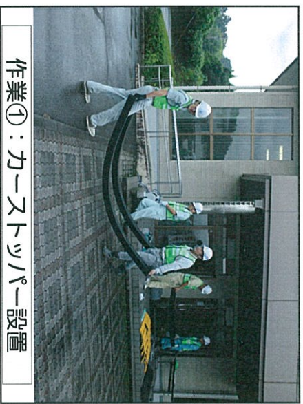
作業①：カーヌトツパー設置