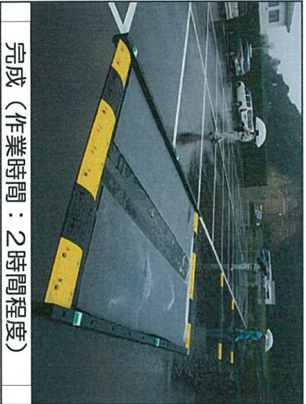
完成（作業時間：2時間程度）