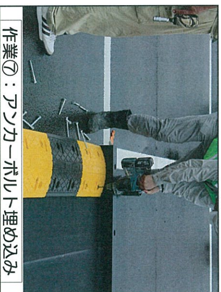
作業⑧：アンカーボルト埋め込み