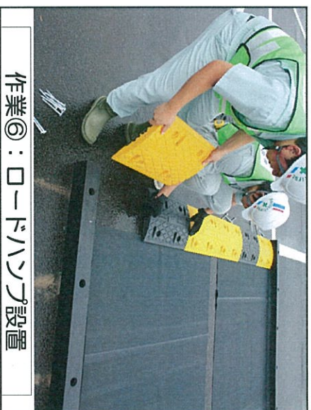
作業⑥：ロードハンズ設置