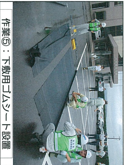
作業⑤：下敷用ゴムシート設置