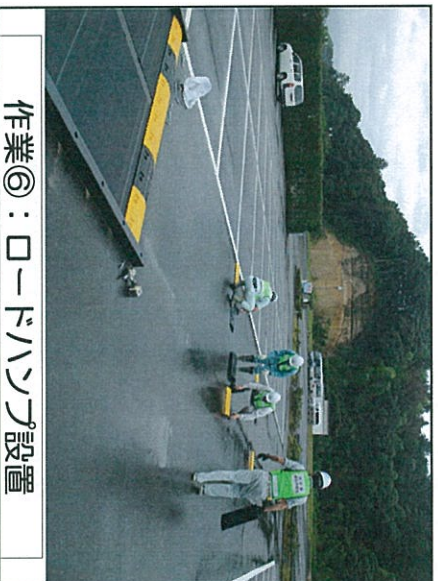
作業⑦：ロードハンズ設置