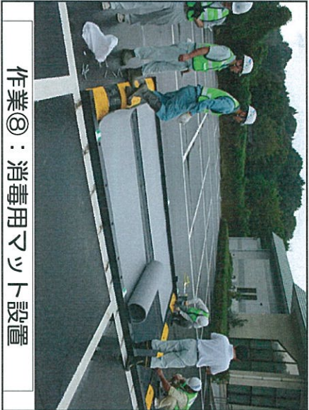
作業⑧：消毒用マット設置