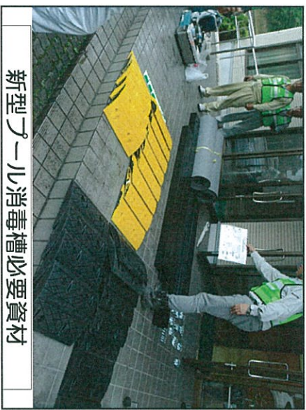
新型ブール式消毒槽必要資材