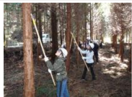
青年森林協力隊（枝打ち体験）