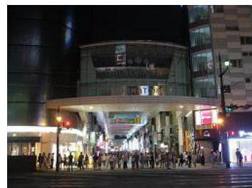
熊本市下通り（実施後）