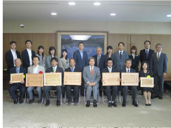
くまもと環境賞表彰式（熊本県知事応接室）

さらに、次世代を担う高校生や大学生等を対象に、山村での宿泊体験研修等を実施し、森づくり活動や地域住民との交流をとおして森林を守り育てる意識の醸成を図りました。