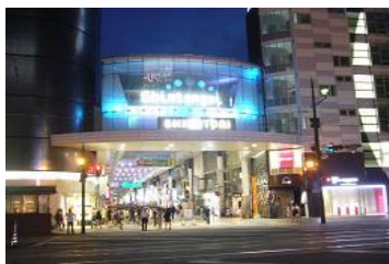
熊本市下通り（実施前）

具体的には、これらの日の夜の2時間、県内施設や事業所の夜間照明や家庭での照明などのライトダウン（消灯）の協力を呼びかけました。この結果、県内延べ6,282施設がライトダウンを行いました。