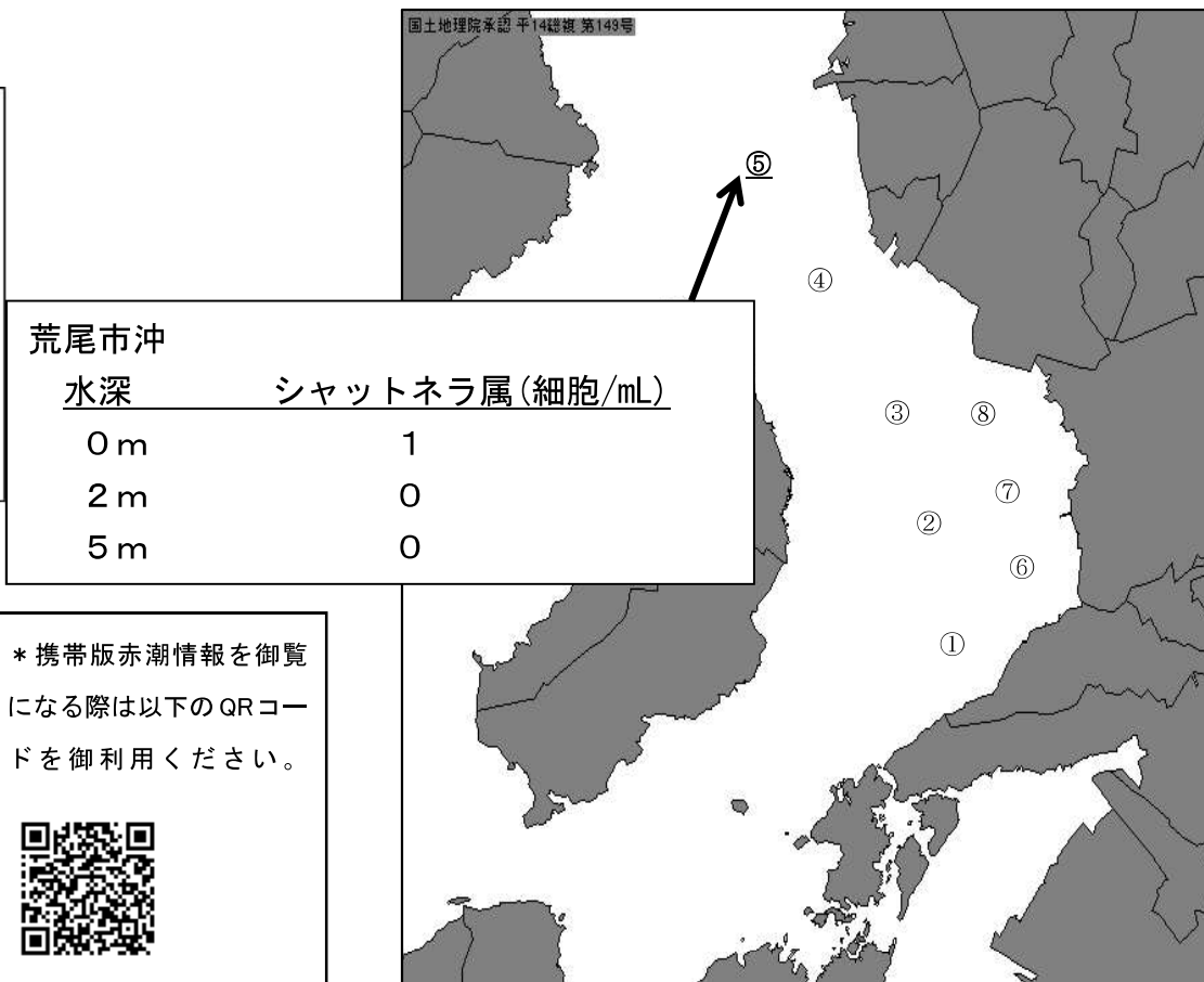
図 調査点（下線部はシャットネラ属が確認された点を示しています。）