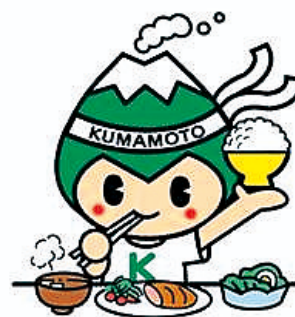
健やか生活習慣くまもと県民運動 キャラクター ASO坊 健太くん