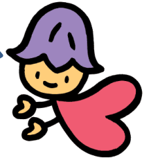
熊本県人権啓発キャラクター コッコロ

派遣する登録講師は、各分野の専門の知識や経験を有し、県主催の研修会等での実績がある方々です。次のような研修等へ派遣し、皆様の人権研修を応援します。