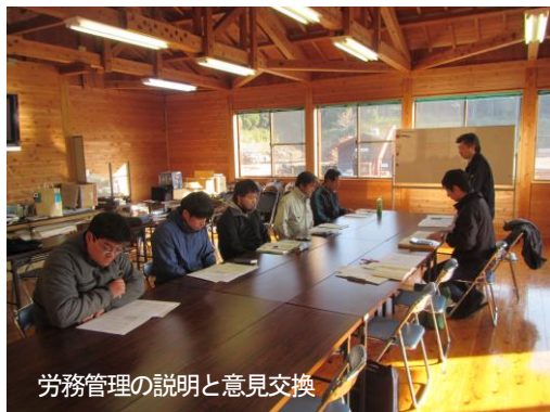
労務管理の説明と意見交換

鹿本森林組合においては、過去 10 年間で森林整備班員が 7 割以上、専従職員数が 4 割以上減少しており、現在それぞれ 17 人、11 人体制で運営しています。昨年度の決算では、前年度に比べ大幅な減収減益となっており、組織強化と的確な事業運営が必要となっています。