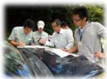
調査状況（球磨郡錦町）

調査は、10月以降に実施されますが、捕獲の成果があがり、地域の関係者への認知が深まり、併せて技術の習得等が図られ、地域におけるシカ捕獲の向上に繋がっていくことが望まれるところです。