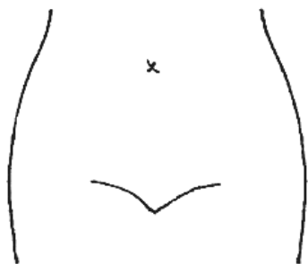
(ストマ及びびらんの部位等を図示)