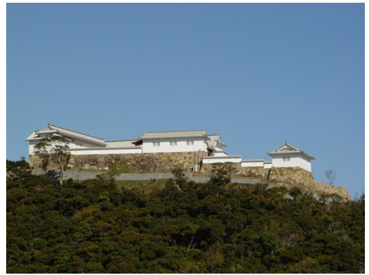
富岡ビジターセンター

また、自然公園利用者の利便性の向上を図るための自然公園施設のリニューアルや、自然環境保全地域などの利用者に対して、適正な利用と保全に関する指導などを行う自然ふれあい指導員（ボランティア）の設置、自然環境講座の開催など自然環境保全に関する普及啓発にも努めています。