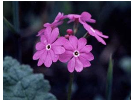
サクラソウ（絶滅危惧Ⅱ類）