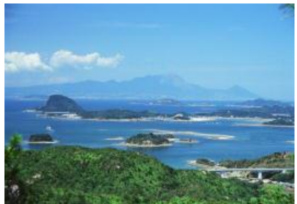
雲仙天草国立公園(上天草市)