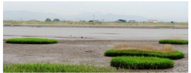
スパルティナ属 (海水と淡水が混ざる汽水域に生育する多年生草本)

全国でも熊本県だけに生育するスパルティナ属については、繁殖力が旺盛で河川機能や生物多様性への影響が懸念されているため、防除に向けた取組を進めています。