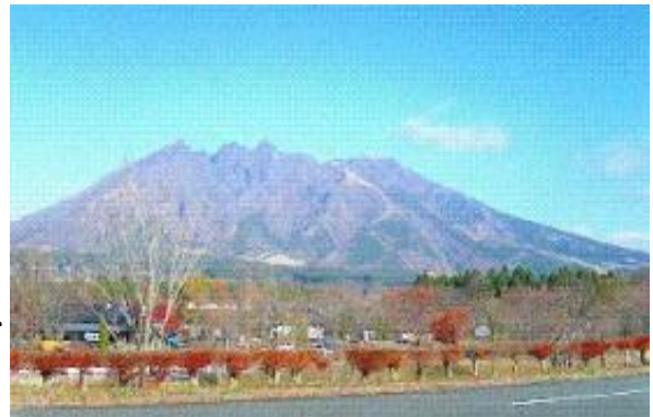
南阿蘇から望む根子岳

本県の優れた景観や自然環境の保全を図るため、様々な広報媒体の利用や県民との連携により、更に自然環境保全の意識を広げていく必要があります。本県の自然公園は民有地が多いため、経済活動との調和を図りながら土地利用などに対する適正な規制や開発行為などにおける環境配慮を推進していく必要があります。