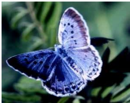
オオルリシジミ（絶滅危惧Ⅱ類）

外来生物については、侵入の防止と侵入初期段階での対応が重要です。また、外来生物の侵入がもたらす問題について県民への普及啓発を行い、外来生物被害予防三原則の「入れない、捨てない、拡げない」を徹底することも必要です。