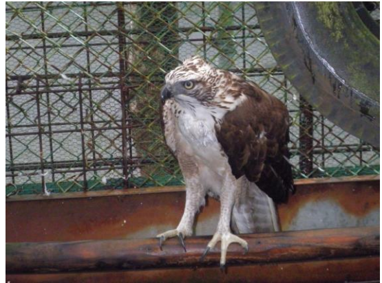
保護された翼を負傷したクマタカ

鳥獣保護センターでは、野生の傷病鳥獣の保護（受入・治療・給餌・リハビリ・放野）を行い、指導及び助言を通して県民への鳥獣保護思想の浸透を図っています。