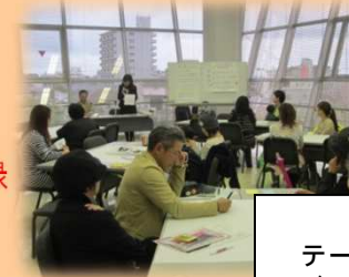
分科会の様子 テーマ「親子にとって身近な祖父母の知恵袋～話して聞いてわかること」

パパ手帳、肥後っ子の日グッズ等により意識の啓発を図る くまもと子育てトークの開催 くまもと子育て応援の店の募集・登録 子育て情報誌の作成・配布