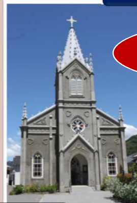
崎津教会と天草の崎津集落