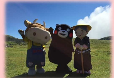
阿蘇・草千里でPR活動を行う くまモン

くまモンは県内の活動だけではなく、くまもとの認知度向上や誘客促進を図るため、県外や海外においてもくまもとの魅力発信を行います。