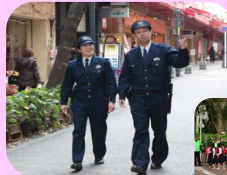
防犯パトロール活動の様子

高齢者の交通事故や振り込め詐欺などの県民生活を脅かす犯罪を抑止するための対策を推進するほか、関係機関や地域住民との連携・協働により、安全で安心して暮らせる熊本の実現に向けた取組みを推進します。