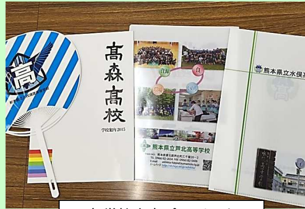
各学校案内パンフレット 学校PRグッズなど

学校活性化対策会議開催 学校案内パンフレット、学校宣伝グッズ （のぼり旗・クリアファイル・うちわ等）作成 学校PR用PV作成