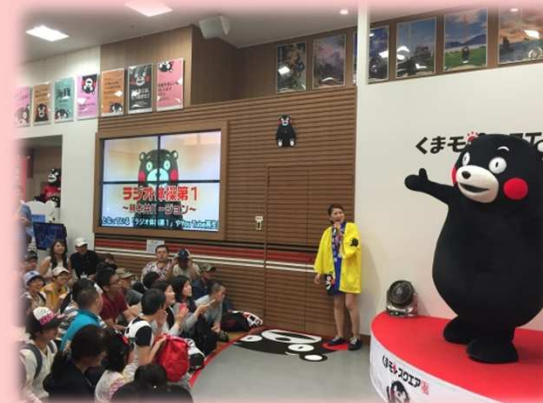
くまモンスクエアでのステージの様子

くまモンは県内の活動だけではなく、くまもとの認知度向上や誘客促進を図るため、県外や海外においてもくまもとの魅力発信を行います。