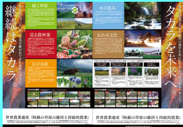
阿蘇地域世界農業遺産推進協会の紹介パネル

世界農業遺産に認定された阿蘇地域において、農産物の付加価値の向上や観光客の増加などの認定効果を最大限に発揮させるため、世界農業遺産アクションプランの着実な推進を図ります。