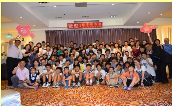
台湾高雄市のホストファミリーとの 交流の様子

熊本の未来を担う肥後っ子を台湾高雄市に派遣して、同市の子どもたちとの交流やホームステイ、台湾の発展のために貢献した日本人の功績の視察等を通して、自分の夢と可能性を発見し、グローバル社会に視野を向けた子どもの育成を図ります。