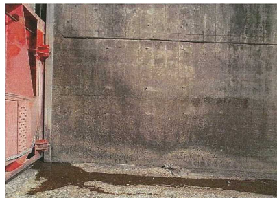
写真② 白石頭首工の老朽化状況