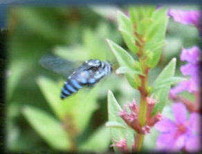
ブルーベリーに会えるかも