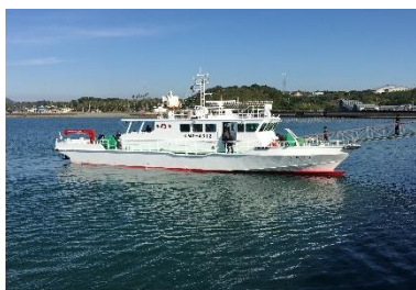
試験調査船ひのくに