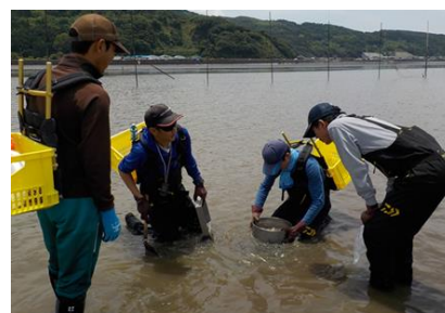
アサリ生息状況調査