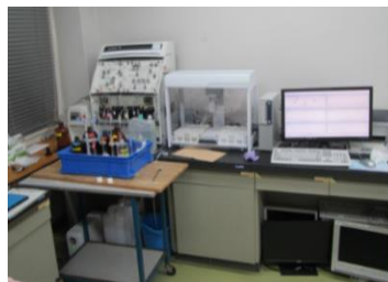
水質自動分析装置