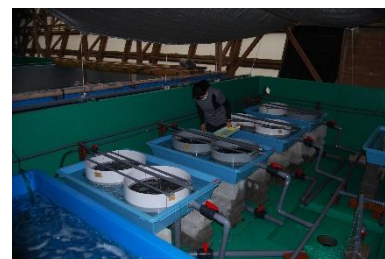
タイラギの中間育成状況