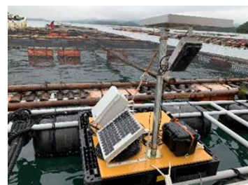
テレメーターシステムの外観