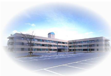
【保健環境科学研究所】

収去した食品の検査(※3)は、 保健環境科学研究所 及び 八代保健所試験検査課 が実施します。検査結果は保健所へ報告され、各保健所の食品衛生監視員が、収去した営業者に対して結果に基づく指導を行います。