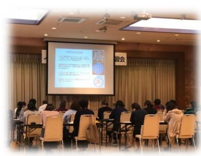
【ノロウイルス食中毒予防講習会】