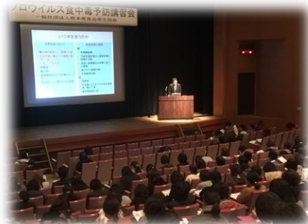
【食品事業者対象の講習会】