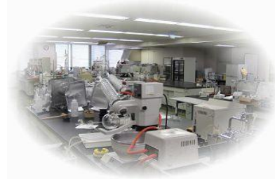
【八代保健所試験検査課】