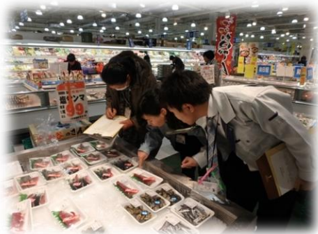
【食品衛生協会と連携して行っている食品衛生に関する普及啓発活動】