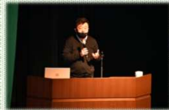
椿事務局長の講義

令和5年度以降も引き続き田んぼダムマイスターの育成を実施し、各地域において、普及・拡大を担っていただく予定としています。