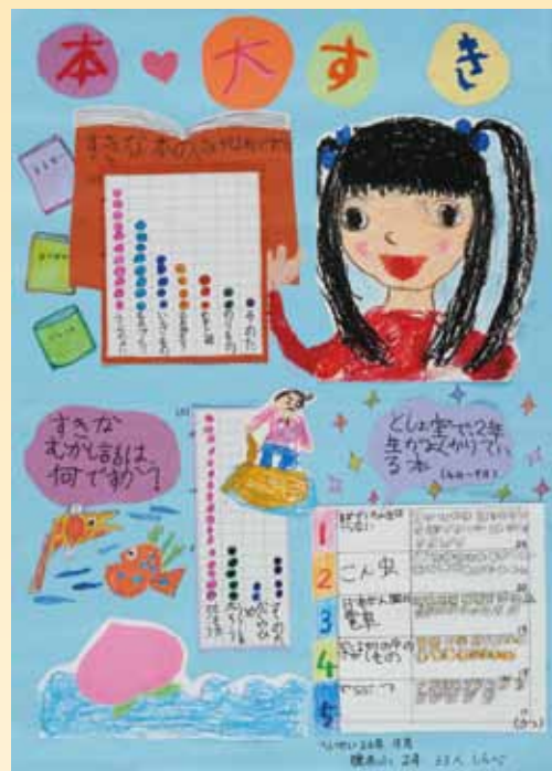
本♥大すき 長洲町立腹赤小学校 2年 上野 未羽 / 元田 夏実 / 稲田 雪花 / 上田 祐梨愛