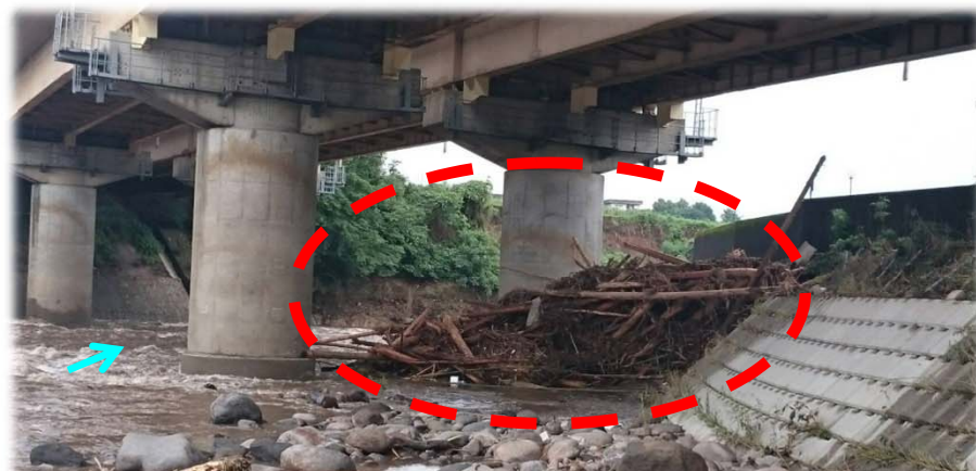
①流木堆積状況(九州自動車道:白川大橋)