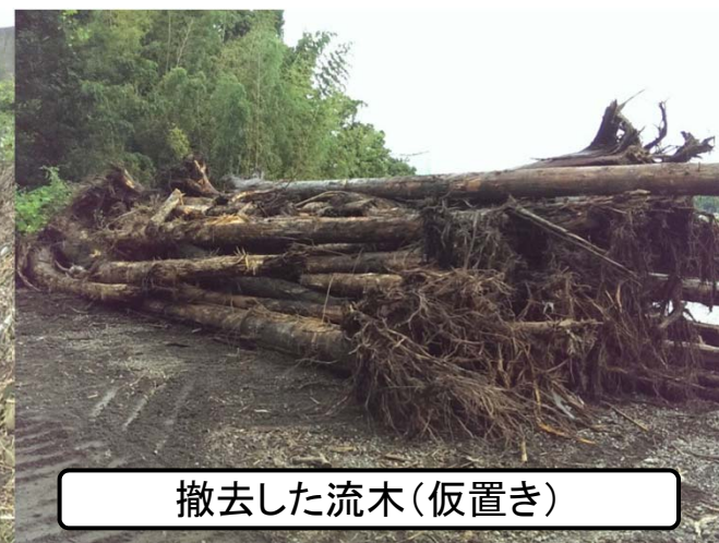
撤去した流木(仮置き)