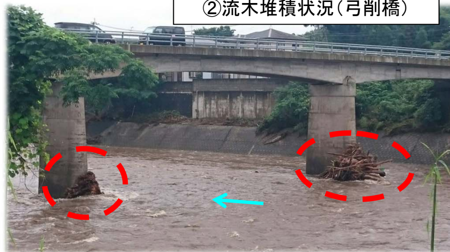
②流木堆積状況(弓削橋)