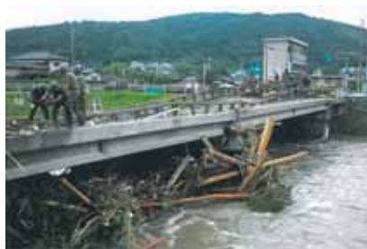
県南集中豪雨災害 平成15年7月18日～20日

近年、異常気象に伴う集中豪雨や記録的な大雨により、全国各地で甚大な洪水被害が発生しています。特に熊本県は、地形的な特性などから梅雨全盛や台風などによる降水量が多く、全国的にみても災害が発生しやすい状況にあります。このような洪水被害に対して、自らの命・家族・財産を守るため、リアルタイムで発表される防災情報を正しく理解・把握し、迅速な避難行動がとれるように日ごろから心がけておきましょう。